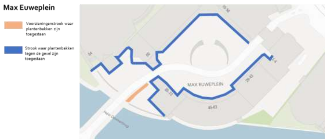
Afbeelding 3: Situatietekening Max Euweplein

Afbeelding 3 geeft inzicht in de delen van het Max Euweplein waar het toegestaan is om plantenbakken in de voorzieningenstrook en tegen de gevel te plaatsen.