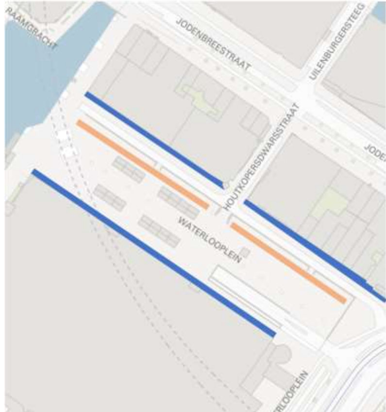
Afbeelding 1: situatietekening Waterloo plein